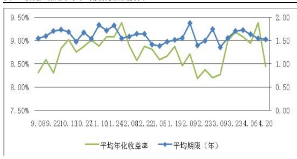
图 3：信托产品近半年平均预期收益走势图

本周共23家信托公司参与成立了53款产品，成立规模约为68.52亿元。较上周相比，本周参与公司数量较上周提升明显，成立产品数量亦增加22款，融资规模较上周相比增长明显，环比涨幅达68.35%，产品平均规模由上周的1.31亿元下降至1.29亿元。本周融资规模有所缓解，开始止跌回升，一方面，伴随着银行等金融机构资金流动性趋紧，本周加大了信托融资规模；另一方面，鉴于“99号文中”明确叫停了信托非标理财资金池业务，并要求已开展的非标资金池业务尽快清理，亦对本周的成立情况产生一定影响。但从近几周的融资规模走势来看，信托市场的融资能力并没有得到明显改善，一直处于低位徘徊。