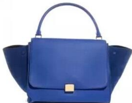
Celine Trapeze手提包 RMB16,740

【新浪女性】世界那么大，你想去看看，怎么能没有一辆像样的座驾？2015年上海国际车展，全球首发109辆，亚洲首发车44辆，新能源车103辆，概念车47辆快选一辆开出去吧！全新一代奥迪Q7家族新成员，它将TFSI插电式混合动力科技与quattro全时四驱技术相结合。 [全文]