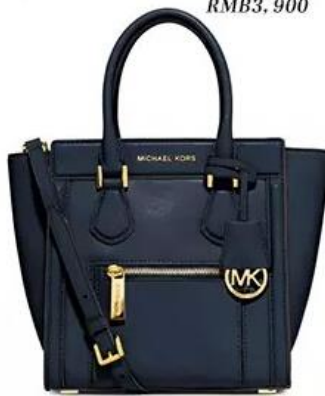
Michael Kors Colette 中号手袋 RMB3,900