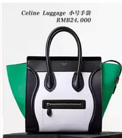
Celine Luggage 小号手袋 RMB24,000